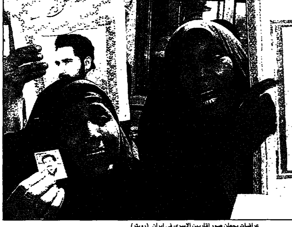
عراقيات يحملن صور الكويين الاسرى في ايران

بغداد - رويترز: قالت صحيفة «الجمهورية» امس الاثنين ان لجنة عراقية تعتمد نشر صور الكويين الذين فقدوا خلال الاحتلال العراقي في محاولة لاقتناع أترجم.